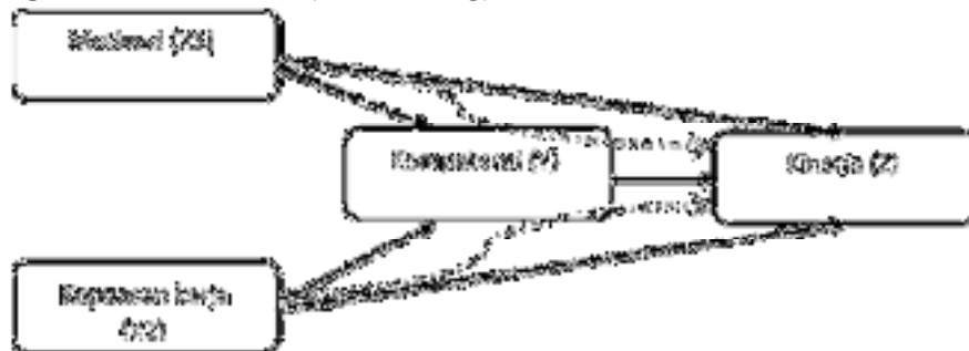
Gambar 1.1 Desain Penelitian

Jenis penelitian ini adalah penelitian kuantitatif yang bersifat verifikatif, yaitu sebuah penelitian yang bertujuan untuk menguji secara matematis dugaan mengenai adanya hubungan antar variabel dari masalah yang sedang diselidiki di dalam hipotesis, atau dengan kata lain, penelitian ini untuk menguji kebenaran suatu hipotesis. Dalam penelitian ini akan diuji hipotesis dari variabel-variabel penelitian yaitu pelatihan kerja dan karakteristik individu yang berdampak terhadap produktivitas kerja, serta variabel kompetensi sebagai variabel antara ( intervening ).